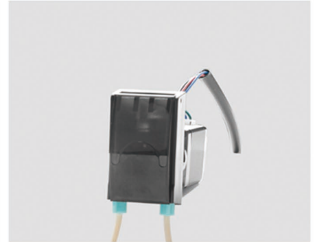
3. 向下合上防护盖， 完成软管安装。