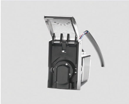
1. 向上掀开防护盖， 打开泵头。