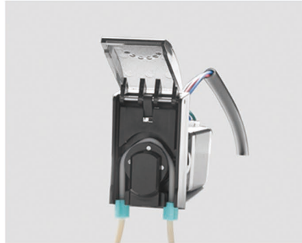
2. 将软管放入泵头， 将软管两侧的接头卡在泵头下部。