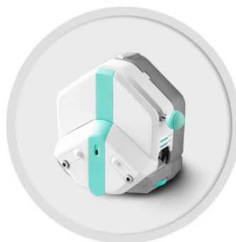
EasyPump 系列 (不可调压)