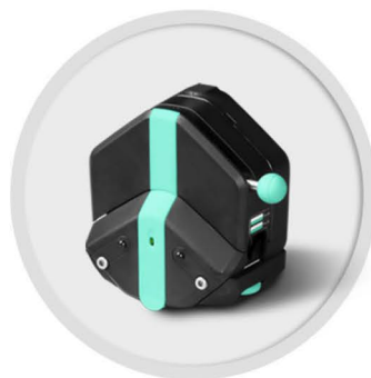
EasyPump-PPS 系列 (不可调压)